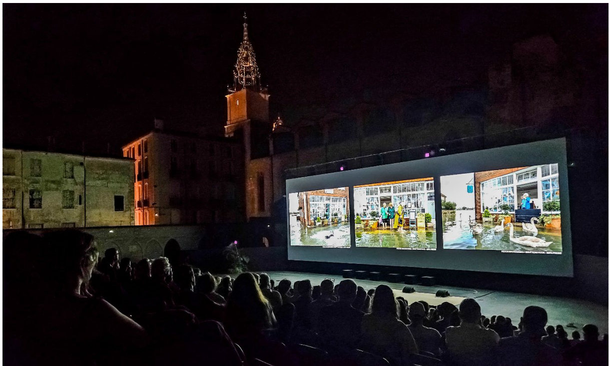
Showene i kveldsmørket byr på mange bildehistorier som ikke vises andre steder under festivalen.

Dette er vårt tredje besøk til festivalen, og siden forrige besøk i 2019 har usikkerheten i verden økt. Det speiles i utstillingene. Det er generelt mye krig og elendighet. Naturlig nok. Men det var hyggelige innsmett av andre typer fotojournalistiske verk også. Om ikke utstilt, så vist fram under kveldsshowene som arrangeres hver dag under «Professional Week». Her oppsummeres fotoåret med to måneder hver kveld, og det gir rom til å vise fram litt mer enn bare krig og naturkatastrofene som gjerne preger mye av utstillingene.