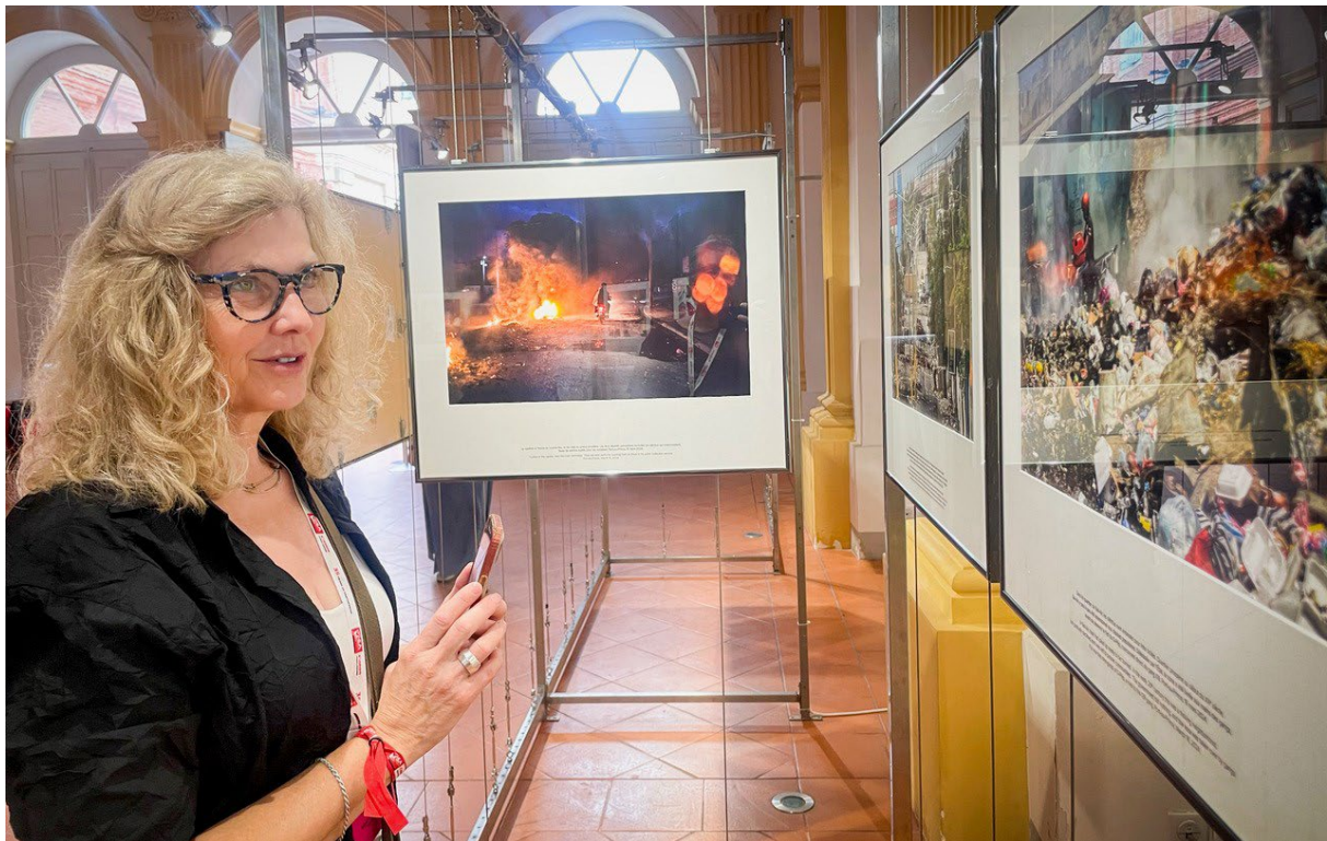
Fotojournalist-neslor i LO Media.

Misforstå oss rett: Det er viktige bilder som vises på de mange utstillingsstedene spredt omkring i byen. Vi som arbeidslivsjournalister skriver og fotografer mye om tariffoppgjør og manglende verneutstyr. Men virkelighetsoppfatningen får seg en dytt når man får se hvordan hele samfunn som Haiti råtner på rot som følge av en blanding av menneskelig egoisme og naturkatastrofer.